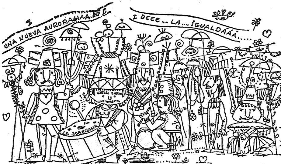
La Soberana vista por Pieri desde las páginas de Marcha (1971)

Me estás hablando de una murga de La Unión. "Los Amantes" ¿de qué barrio salían?