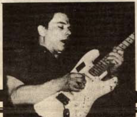
Los Fabulous Thunderbirds: Kim Wilson, Fran Christina, Jimmie Vaughan y Preston Hubbard.

Jimmie Vaughan tocando la guitarra como se debe.