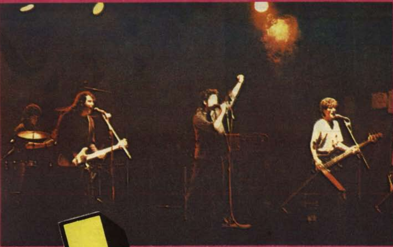
Los Estómagos en Montevideo Rock.

Un año 'par' menos. Se fue del todo mil novecientos ochenta y seis, año de democracia (el segundo), año en el que el canto se popularizó con el resurgimiento más fuerte que se haya visto y oído del rock nacional; la música se oyó, se vio y a partir de DIA POP comenzó a leerse.